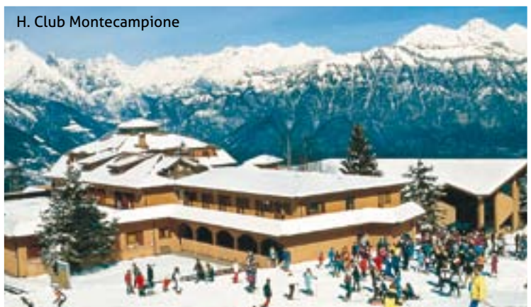
H. Club Montecampione