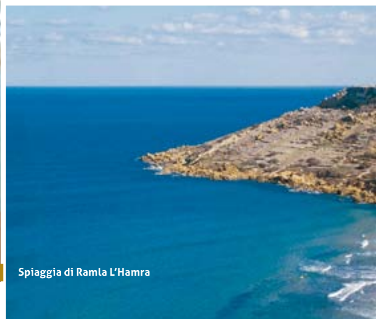
Spiaggia di Ramla L'Hamra